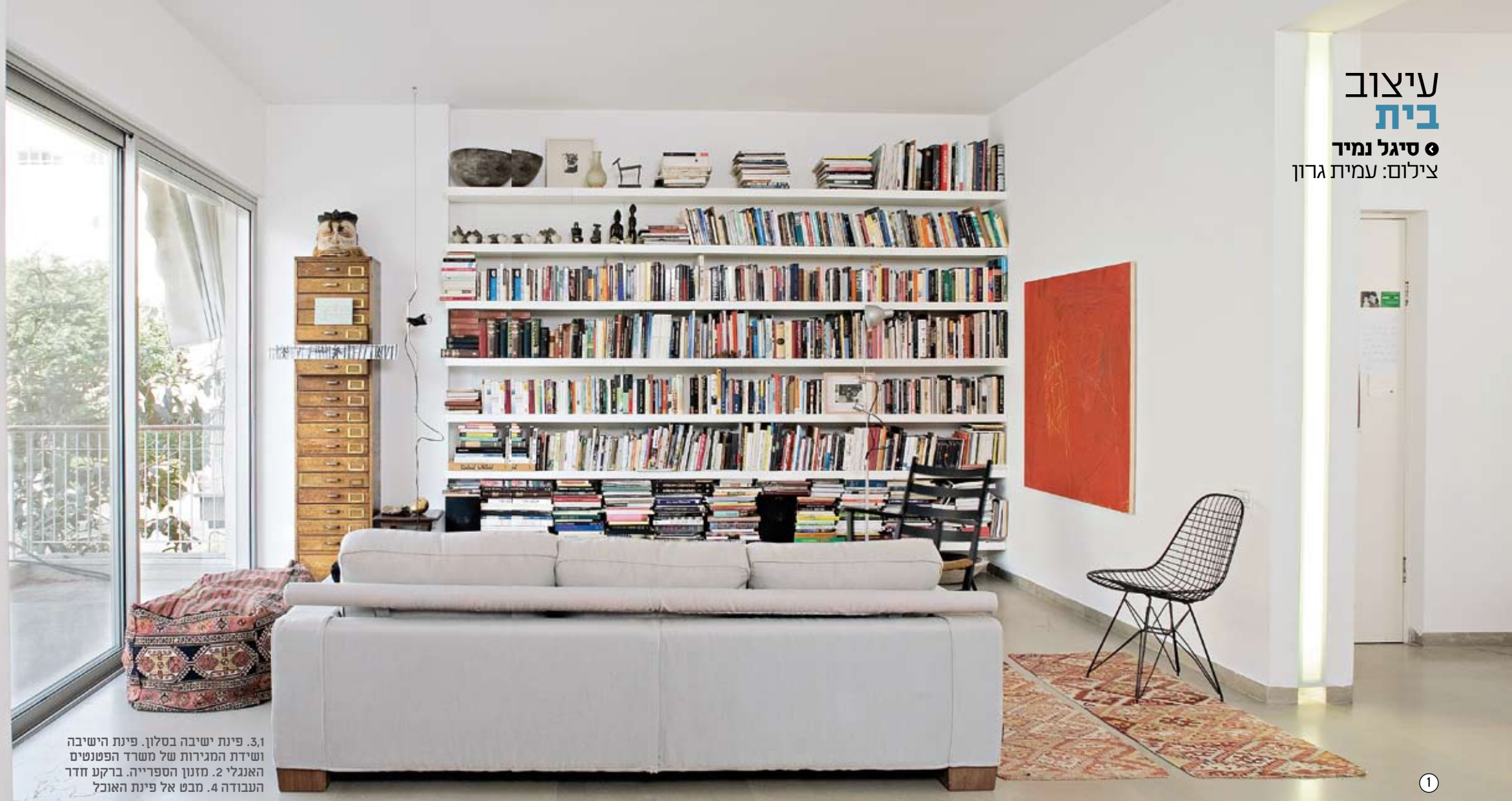
3.1 פינת ישיבה בסלון. פינת הישיבה ושידת המגירות של משרד הפטנטים האנגלי 2. מזנון הספרייה. ברקע חדר העבודה 4. מבט אל פינת האוכל