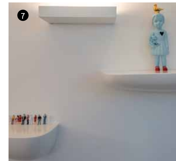
3. המבואה הפכה לחלל ציבורי שסביבו כל חדרי הדוירים. 4. מבט לעבר גרם המדרגות מהקומה העליונה. 5. חדר השינה של ההורים. שימוש בנגרות נקייה ליצירת תחושת מרחב (נגרות חן גניס). ברקע צילום של יאיר ברק וציור של גל כהן. 6. מבט אל מדפי הספרייה היוצרים את המדרגות לקומה השנייה. 7. פינה מתוך הסלון בקומה התחתונה